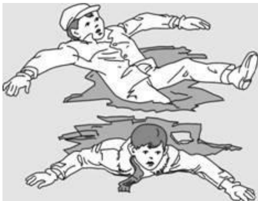
Попытки вылезти самому из полыньи грудью или спиной

Если вы провалились под лед, широко раскиньте руки, навалитесь грудью или спиной на лед и постарайтесь вылезти на него самостоятельно, зовите на помощь.