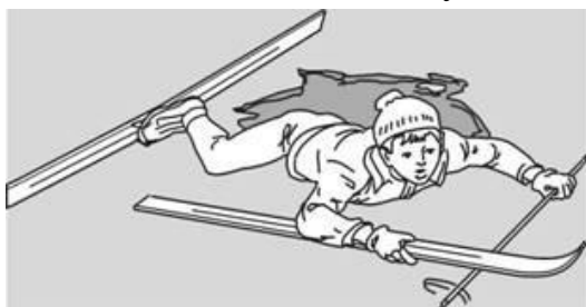
Попытки вылезти самому из полыньи с лыжами

Провалившемуся необходимо внушить, чтобы он широко раскинул руки на льду и ждал помощи, так как самостоятельная попытка вылезти из воды может привести к новому обламыванию кромки льда и очередному погружению пострадавшего под лед.