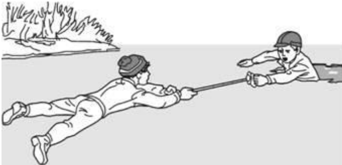
Помощь лыжной палкой

ложатся на лед и цепочкой продвигаются к пострадавшему, удерживая друг друга за ноги, а первый подает пострадавшему лыжные палки, шарф, одежду и т. д. Деревянные предметы (лестницы, жерди, доски и др.) необходимо толкать по льду осторожно, чтобы не ударить пострадавшего. Спасатель при этом должен обезопасить и себя. Продвигаясь к пострадавшему, следует лечь на доску, лыжи и другие предметы.